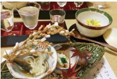
▲一晩で人気料理店を数件ハシゴして 県内の美味しいお酒を飲み比べできるイベント 「ぐるぐる山口の酒」

水津 「ぐるぐる」といえば、や まだやさんですね。周南市内 の飲食店に蔵元さんが入られ てそれぞれのお店をまわりな がらお酒と料理を楽しむ。