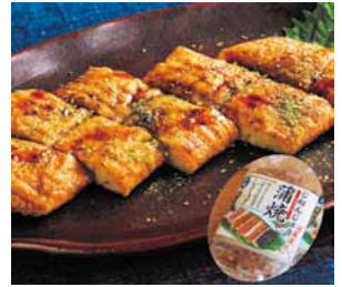
▲じねんじょうの蒲焼き 720円 (税込)