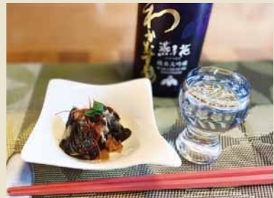
★好きなお酒…甘口の日本酒