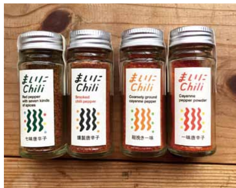
「まいに chili」4種類（七味、一味、粗挽き、燻製） 各 800円～950円（税込）

今、地元・周南でとれた特産物を活かした新名物が続々と誕生しています。こんな美味しいものが身近にあったんだ！とふるさと再発見の味。手土産にする前に、まずは自分で味わってみませんか？