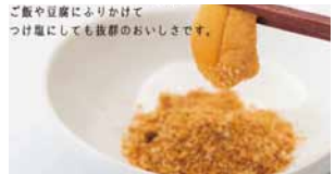
ご飯や豆腐にふりかけて つけ塩にしても抜群のおいしさです。