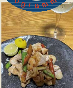
★好きなお酒…日本酒、ワイン

◀「ただ焼くだけ、和えるだけコレに限る笑」 常備調味料は、オリーブオイル・塩・塩麴・醤油麹。