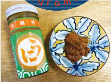
★好きなお酒…ビール(時にチェイサー)、日本酒、ワイン…お酒全般(笑)