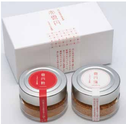
ミョウバン不使用赤雲丹セット 雲丹粉&雲丹塩 18,000円 (税込)