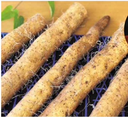
じねんじょう山芋 1本 500円～