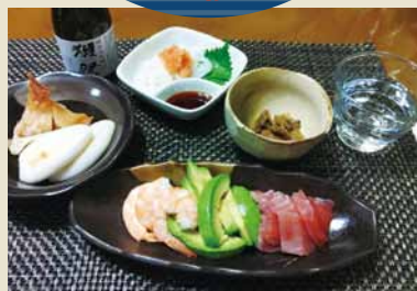
★好きなお酒…冷酒、ビール、お酒全般

「ラリーボイスJam784」(金) 「かくせんのRock the Nation」 「落語の風II」